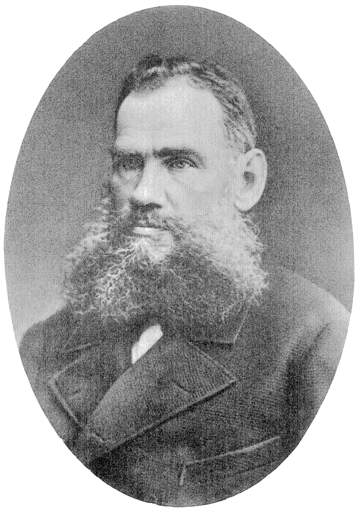
Л. Н. ТОЛСТОЙ в 1881 г.